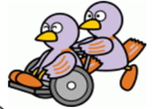
埼玉県 マスコット コバトン

志木市地域支え合いは、埼玉県の福祉政策です。事業主体は志木市商工会、ボランティア活動はNPO法人 東上まちづくりフォーラム・お手伝い隊が担当しています